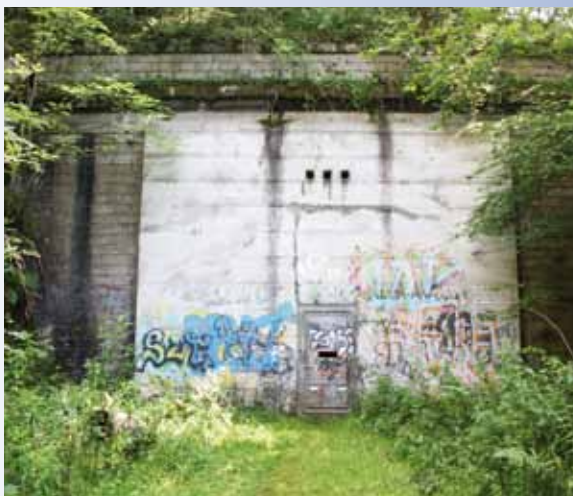
Entrée ancien tunnel de la Cassière, côté Fontfreyde (Saint-Genès-Champagnelle)

L'article L 563-6 du code de l'environnement stipule que toute personne ayant connaissance d'une cavité souterraine « dont l'effondrement est susceptible de porter atteinte aux personnes ou aux biens, ou d'un indice susceptible de révéler cette existence » doit en informer le maire.